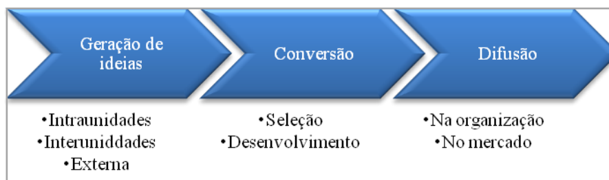
Figura 4 - Cadeia de Valor da Inovação Fonte: Hansen e Birkinshaw (2007).

O trabalho que mais se distingue dos demais, por considerar importantes também outras etapas (pré e pós-desenvolvimento) além do PDP, é a proposição de Hansen e Birkinshaw (2007), sobre a cadeia de valor da inovação, ilustrada na Figura 4.