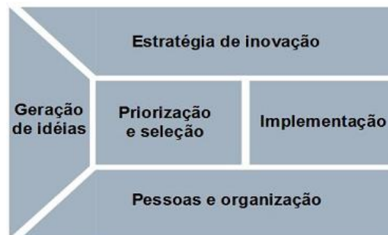
Figura 3 - Pentathlon Framework

Goffin e Mitchell (2005) apresentam o Pentathlon Framework, modelo baseado em cinco estágios para o processo de gestão da inovação, como pode ser visto na Figura 3. O eixo central do modelo refere-se às etapas de desenvolvimento de produtos, a saber: (i) geração de idéias; (ii) priorização e seleção; e (iii) implementação. A etapa de geração de ideias comporta aspectos relativos à gestão do conhecimento, criatividade, percepção de demandas de mercado, além dos mecanismos de proteção das ideias (propriedade intelectual). Na fase de priorização e seleção são considerados aspectos como avaliação de projetos e gestão de portfólio. A implementação refere-se às atividades de gestão de projeto, gestão de riscos e avaliação.